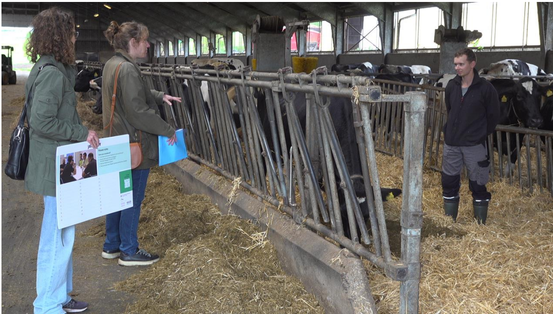
Figur 1 Situationsbillede fra optagelse af video om sikkerhedskalenderen til sociale medier.