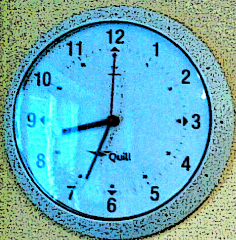
Fountain House Copenhagen