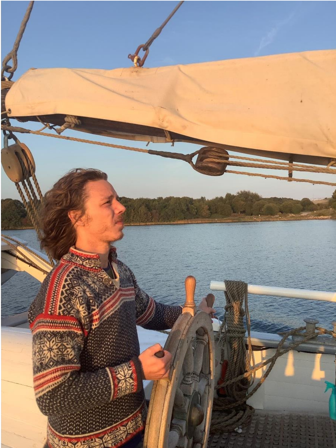
Figur 26. Esbjerg matros tager styringen