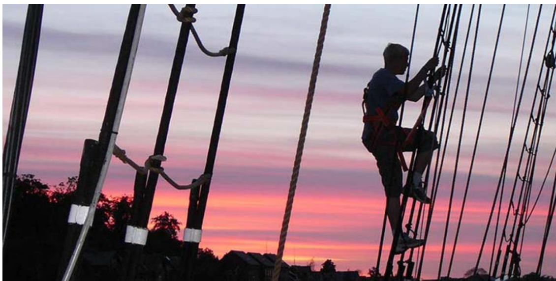
Figur 20. På vej mod masten

der videre på resultaterne, kan det siges, at det at blive set og hørt og være en del af et større fællesskab er et afgørende forhold, når der opsummeres på de unges udtalelser. Sammenfatningerne i figur 17 og 18 beror på tværgående opsamlinger af de unges udsagn og kan derfor siges at tegne et overordnet billede af de forhold, der er betydningsfulde for de unge og Fulton-projektet.