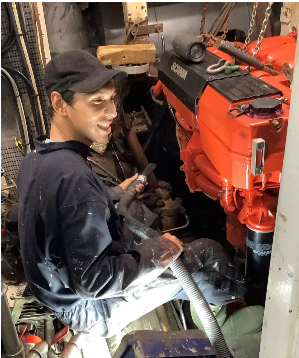
Figur 22. Esbjerg matros i maskinrummet. © Fulton