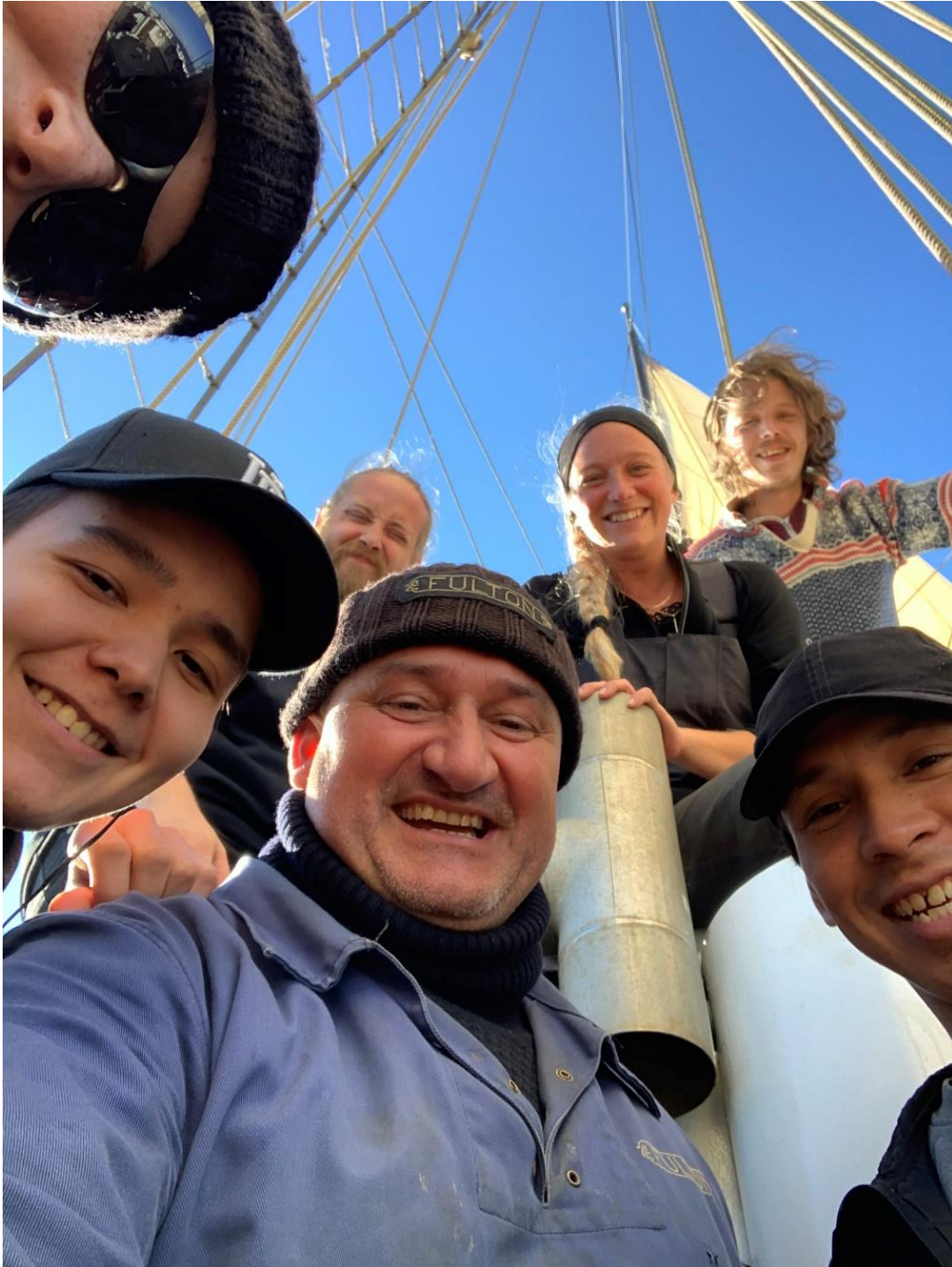
Figur 31. Esbjerg-matroses og besætning ©. Fulton